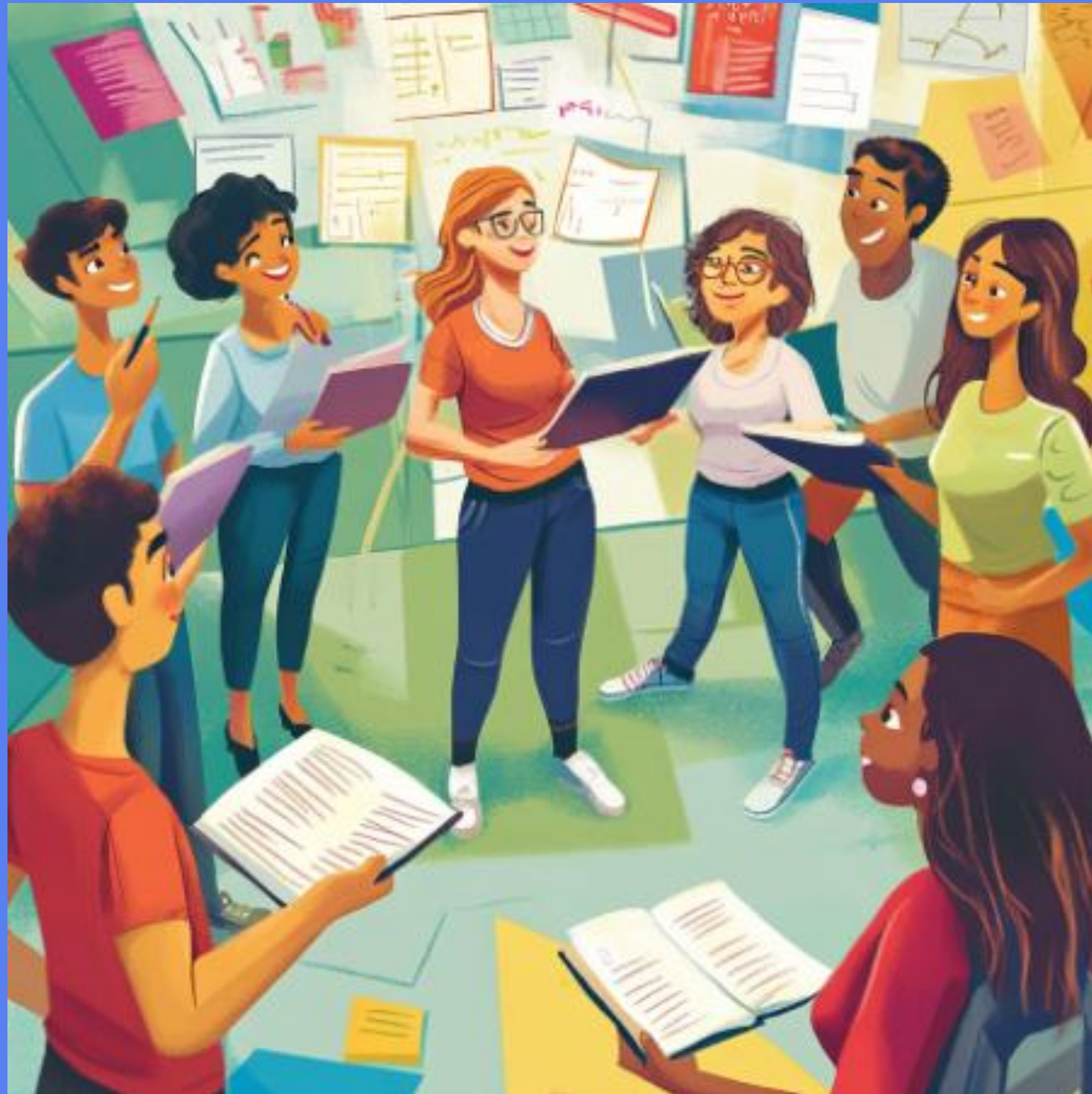
Estudiantes colaboran en clase, compartiendo ideas y promoviendo inclusión.