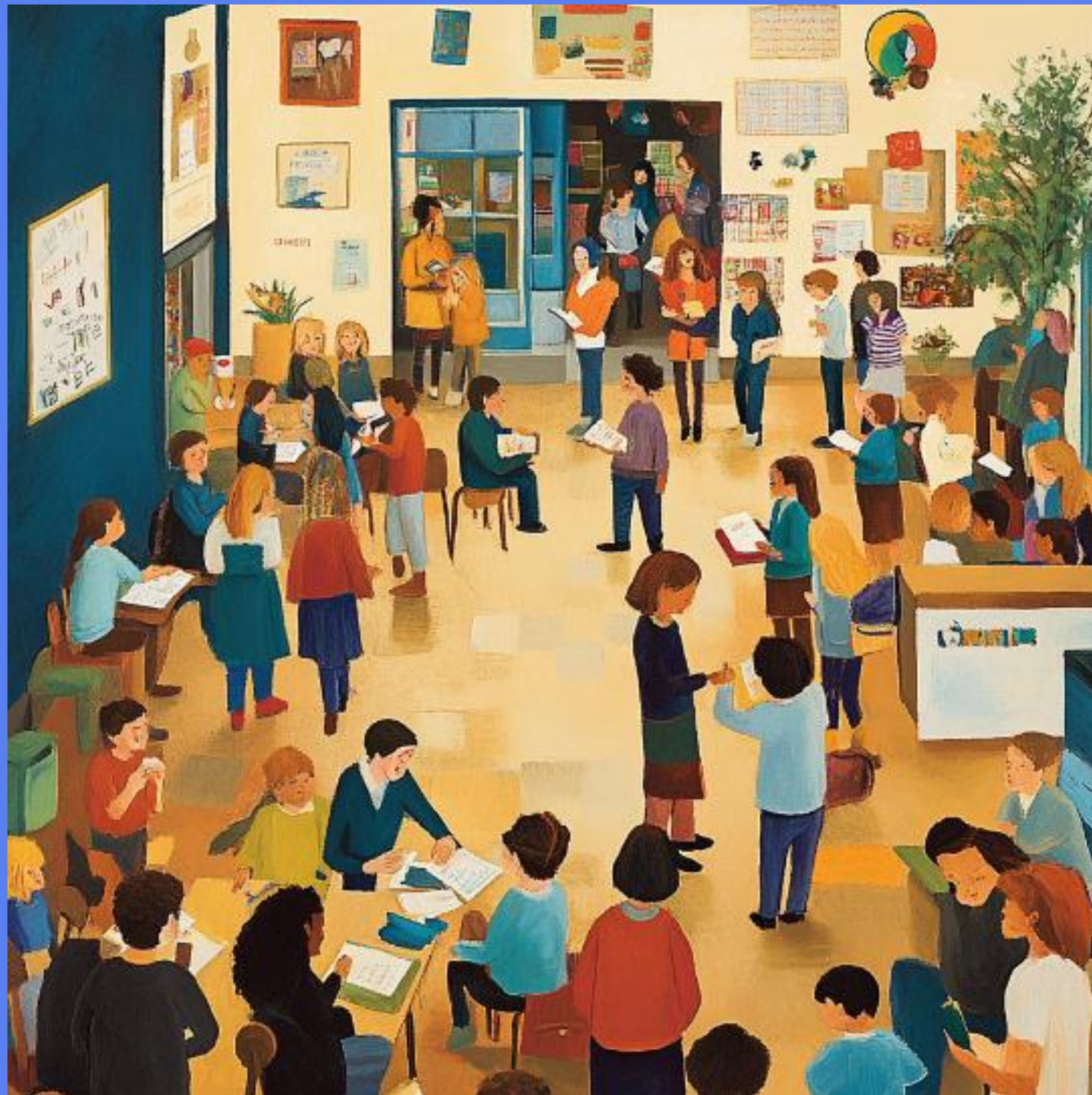
Escuela y comunidad: colaboración docente y familiar para la inclusión.