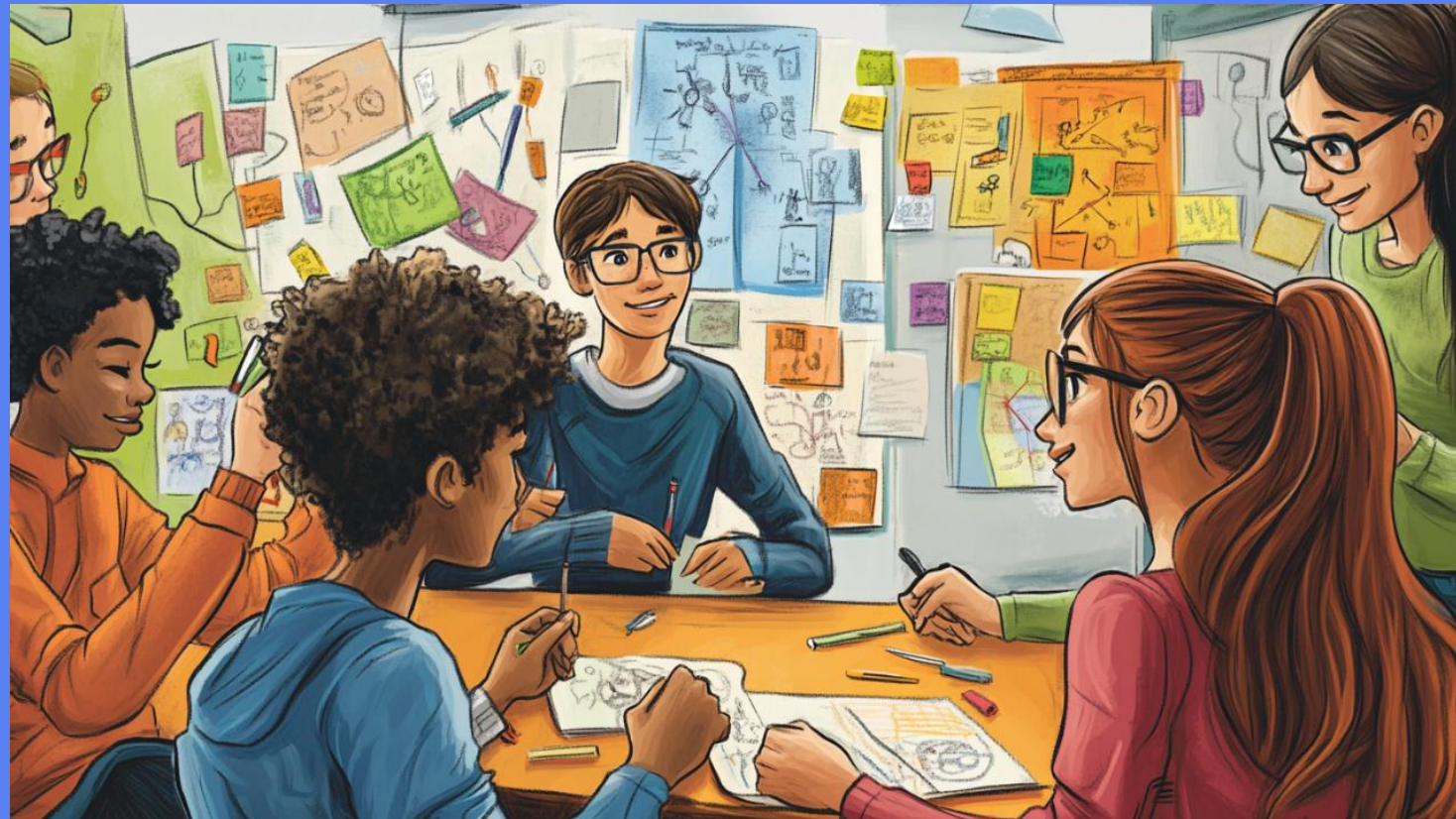
Estudiantes colaboran en elementos de cohesión, fomentando la inclusión.