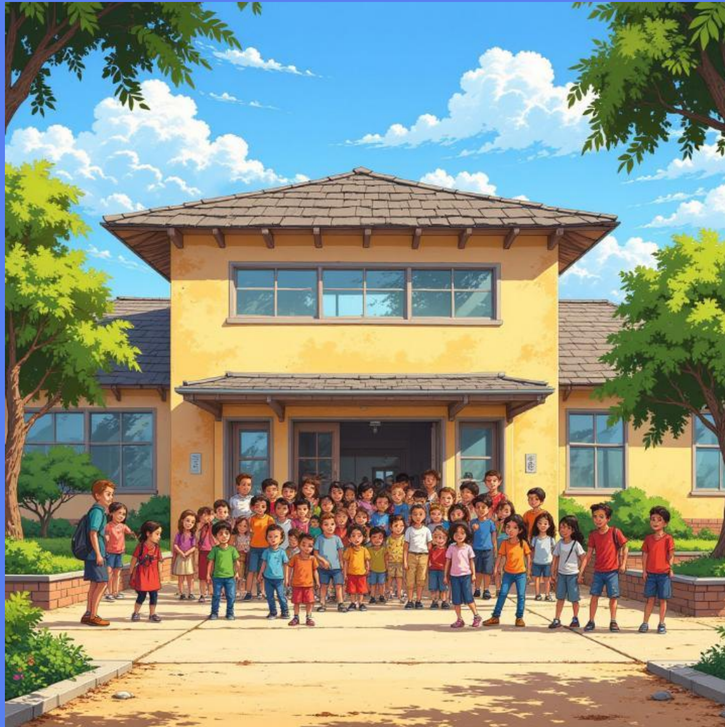
Niños diversos celebran la unidad y la inclusión en la escuela.