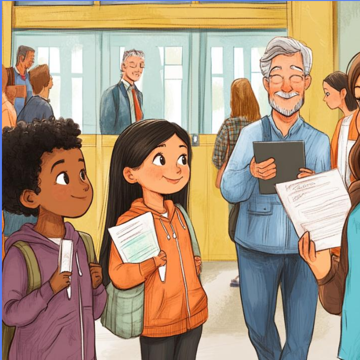
Ciudadanía en la escuela: aprendizaje y convivencia.