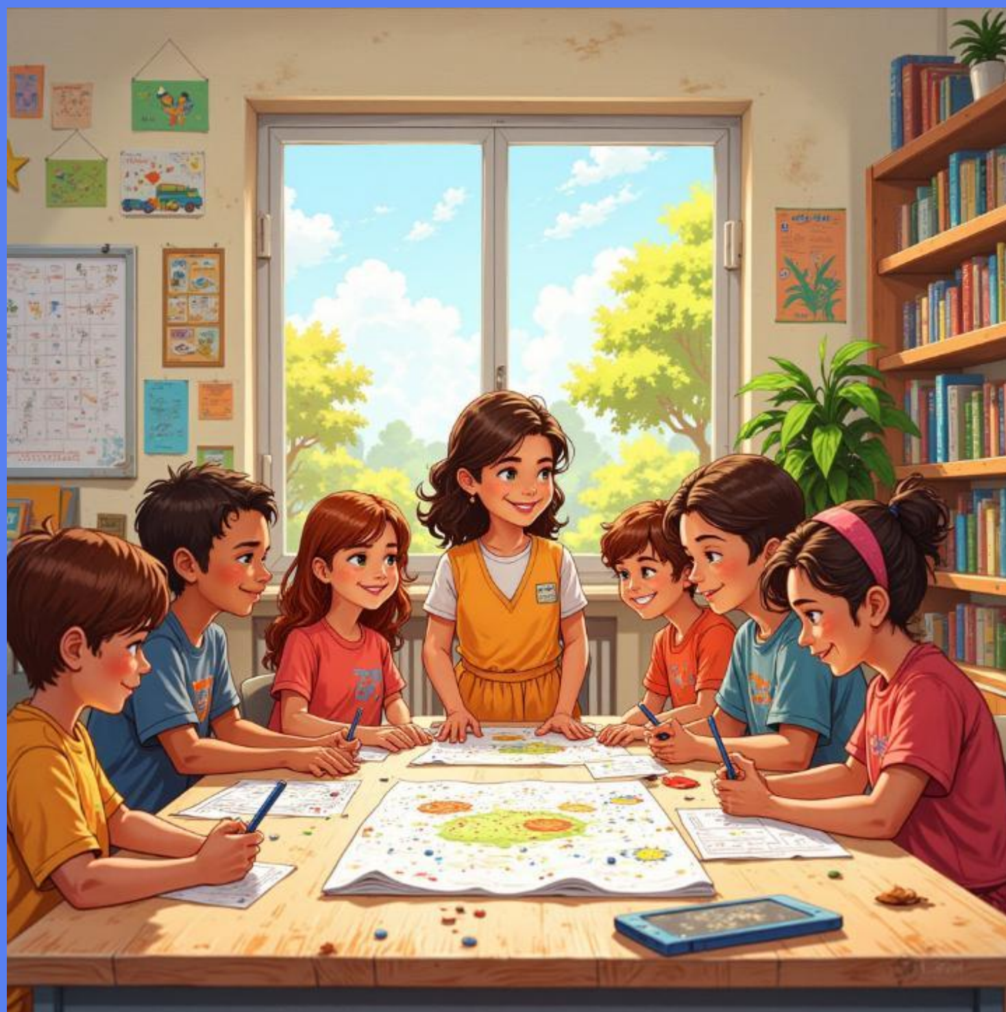
Niños aprenden sobre diversidad social y cultural en aula.