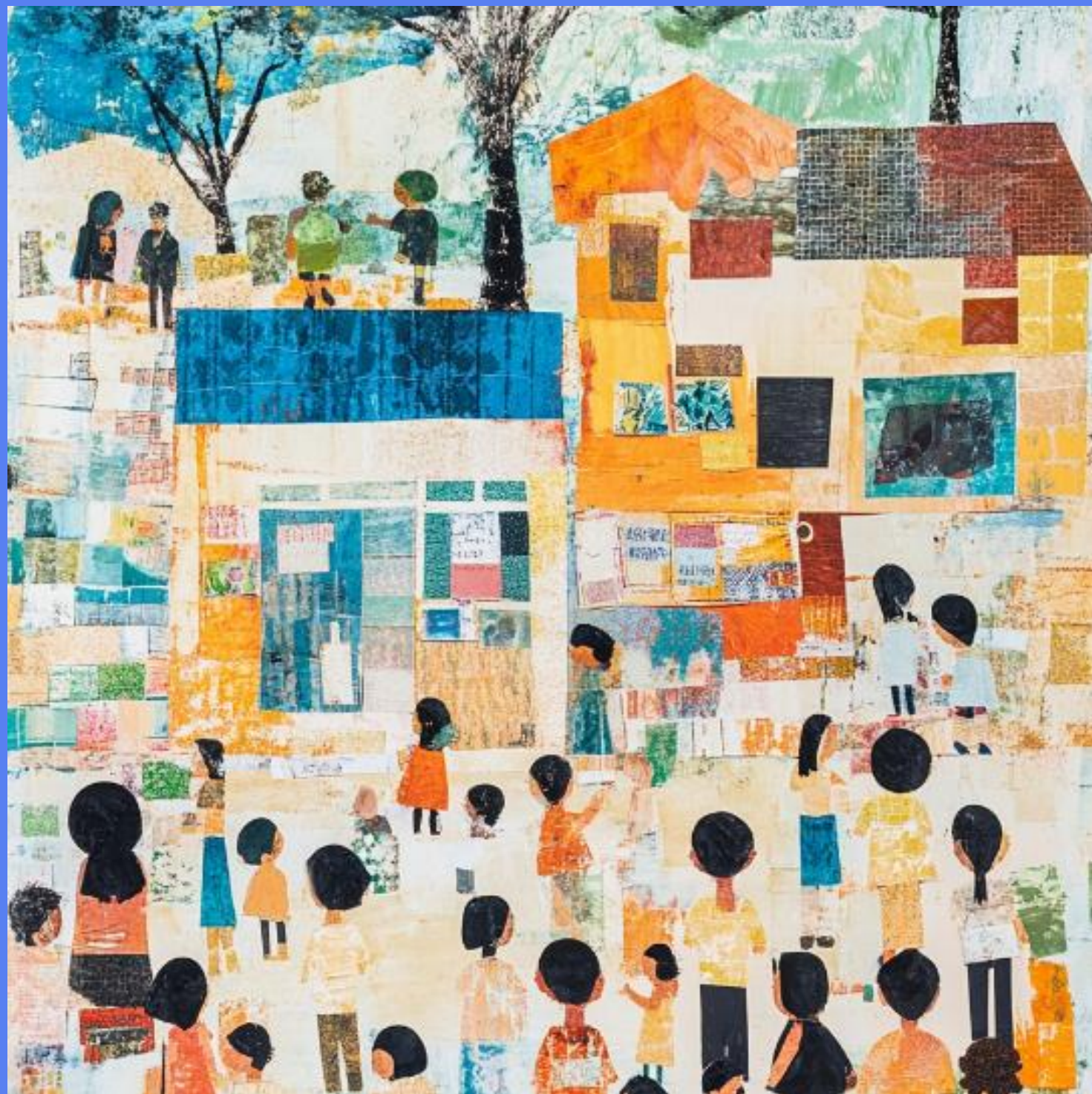
Conexión escuela-comunidad: fomento de ciudadanía activa y paz escolar.